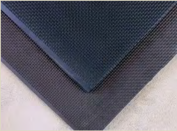
Poroplatte MOLSOFT , schwarz, dunkelbraun 4 - 6 - 8 - 10 mm 800 x 650 mm VE Platte 14 01 914 - 919