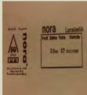
Polsterplatte LUNALASTIK 07 hautfarben 3, 4, 6 mm, 850 x 610 mm VE Platte 09 80 703 - 706