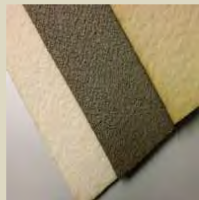
Plantagen-Crepe , 4 - 6 - 8 mm 900 x 320 mm, creme + smoke honig nur 2 mm VE Platte 14 01 050 - 052

weitere Schaumqualitäten auf Anfrage – bitte sprechen Sie uns an.