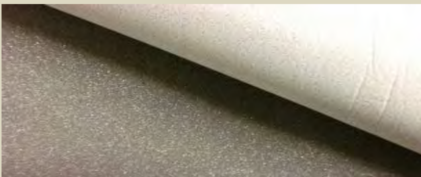
Schaumstoff für Schaftpolsterungen einseitig mit Gewebe kaschiert

Raumgewicht 30 kg / m 3 Dicke 3 mm anthrazit