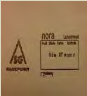
Polsterpl. LUNAIRMED 07 haut, 3 - 6 - 8 - 12 mm 980 x 640 mm VE Platte 09 80 553-612