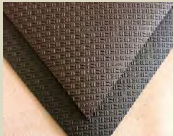
Poroplatte nora ASTRO SOFT 81-schwarz, 46-dunkelbraun 4 + 6 + 8 mm 820 x 510 mm VE Platte 09 40 104 - 108