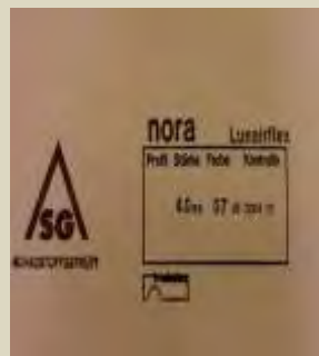
Polsterplatte LUNAIRFLEX 07 hautfarben 3 + 4 + 6 mm, 980 x 640 mm VE Platte 09 80 303 - 306