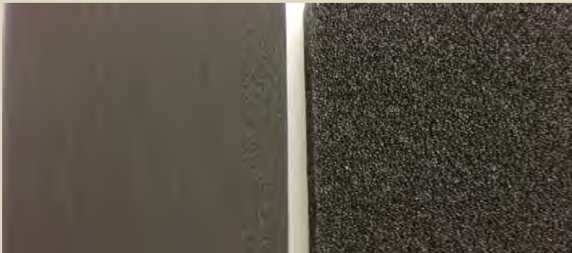
Schaumstoff für Schaftpolsterungen , retikuliert, anthrazit Raumgewicht 50 kg/m 3 , Dicke 3 mm Raumgewicht 100 kg / m 3 , Dicke 5 und 7 mm 2000 x 1000 mm VE Platte 14 91 003 - 007

weitere Schaumqualitäten auf Anfrage – bitte sprechen Sie uns an.