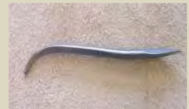
Querörter No. 281, 281 a, sortiert VE 36 Stück 38 05 281 - 289