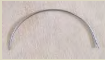
Polsternadeln , 1/2 gebogen 65 - 80 - 90 - 100 mm VE 25 Stück 42 10 065 - 100