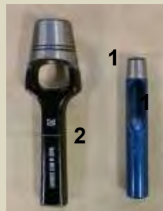
1 Locheisen, rund 1 – 6 mm 45 42 001 Locheisen, rund 7 mm 45 42 007 Locheisen, rund 8 mm 45 42 008 Locheisen, rund 9 mm 45 42 009 Locheisen, rund 10 mm 45 42 010 2 Henkellocheisen 9+10 mm 45 42 110 Henkellocheisen 20 mm 45 42 120