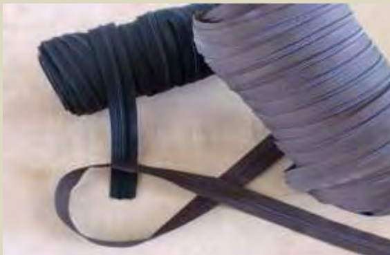
Kunststoffreißer - Meterware, mittelkräftig, Kette + Band schwarz oder braun, 31 50 008