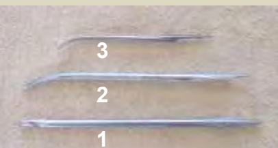
1 Plattörter mit Häkchen 38 02 270 2 Plattörter mit Rille 38 03 300 3 Plattörter 272 m. Loch, gebogen VE 12 Stück 38 03 272