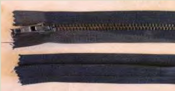
Metall – Reißer MU S lackiert, Kette + Band schwarz, mit Schutzband Länge 17 - 19 - 21 - 22 - 23 - 24 cm VE 10 Stück 31 03 017 - 024