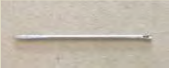
Kürschnernadeln Gr. 1 - 2/0 - 3 - 4/0 - 5 - 7 - 9 VE 25 Stück 42 07 000