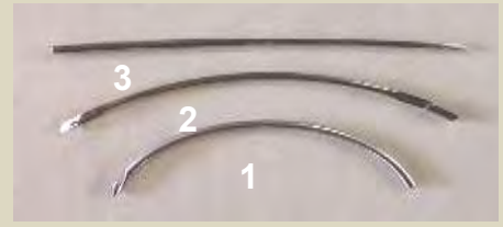
Doppelnadeln , VE 10 Stück 1 6002 Rafflenb. No 45 + 47 42 22 000 2 761PG Frobana No 4 + 5 42 20 004-005 3 1551 No 5, 6 42 21 000