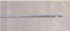
Hakennadeln , gerade 1,80 x 95 mm VE 50 Stück 42 05 000