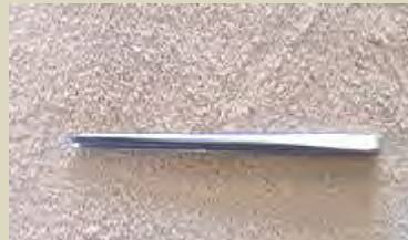
Nagelörter , flach Gr 0, 1, 3, 4, 5 VE 50 Stück 38 10 000-005 Nagelörter , rund Gr 0, 1 VE 50 Stück 38 11 000-001