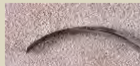
Doppelahlen 8044 Rafflenb. No 43 - 45 - 47 VE 10 Stück 42 25 000