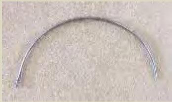
Garniernadeln , 1/2 gebogen 75 - 100 - 125 - 150 - 175 200 - 250 mm VE 25 Stück 42 10 075