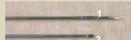
1 Matratzennadeln , Doppelspitze 250 - 300 - 350 - 400 mm VE 25 Stück 42 04 299-400 2 Matratzennadeln , eine Spitze 100 - 125 - 150 - 175 - 200 250 - 300 - 350 mm VE 25 Stück 42 04 100-298