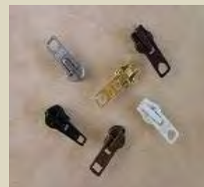
Metall-Schieber mittelkräftig nickel, messing, antikkupfer, schwarz, braun, weiss VE 10 Stck, 31 50 020 Metall-Schieber, kräftig messing, schwarz, braun VE 10 Stck, 31 50 030 Kunststoff, mittelkräftig schwarz, braun 31 50 028