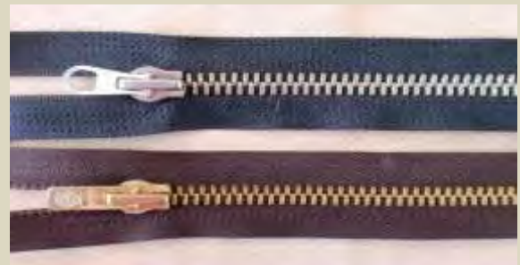
Metall – Reißverschluss KT, teilbar, kräftig Kette nickel, Band schwarz, braun L: 40 - 45 - 50 - 55 - 60 - 65 - 70 - 75 - 80 cm VE 10 Stück 31 08 040 - 080