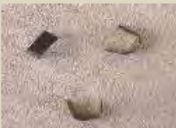
Endteile mittelkräftig schw., braun, messing VE 100 Stck 31 50 050