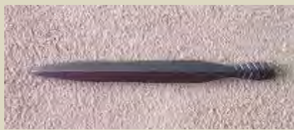
Sattlerahlen , VE 12 Stück 40- 45- 50- 55- 60- 65- 70- 75- 80- 85 90- 95-100 mm 38 20 050-100