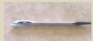
Lochahlen 175 - 225 mm VE 12 Stück 38 23 175 - 225