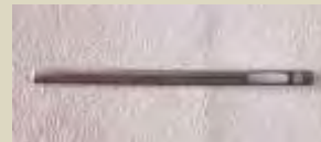
Reihnadeln 70 mm VE 25 Stück 42 08 000