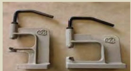
Spindelmaschine klein 45 41 401 Spindelmaschine mittel 45 41 402 Spindelmaschine groß 45 41 403