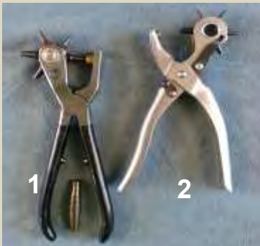
1 Revolverlochzange, massiv geschmiedet, VE Stck mit 6 Pfeifen 45 42 173 Pfeifen dazu VE St 45 42 175 2 Revolverlochzange, einfach mit 6 Pfeifen VE St 45 42 180 Pfeifen dazu VE St 45 42 181