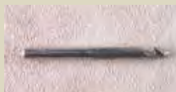
Durchnähadeln No 4001, 4035 VE 10 Stück 42 28 000