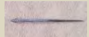
Steppahlen 60 - 70 - 80 - 85 - 100 mm VE 36 St. 38 08 060-100