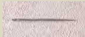
Handnähadeln , kurz Gr. 1 - 2 - 4 - 5 - 7 VE 25 Stück 42 06 000