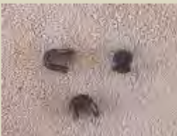
Anfangsteile, mittelkräftig schw., braun, messing VE 100 Stck 31 50 050